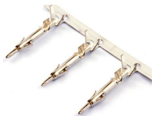
Контакты для MFB-...F