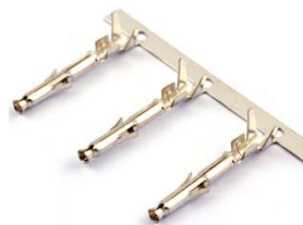
Контакты для MFB-...M