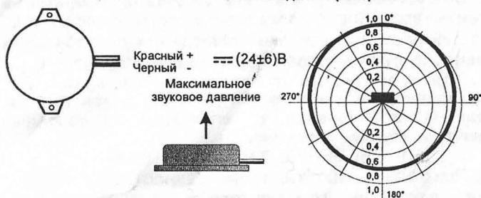
Рис.2 Схема подключения и диаграмма направленности оповещателя ПКИ-МШ.

Диаграмма направленности ПКИ-МШ в свободном пространстве