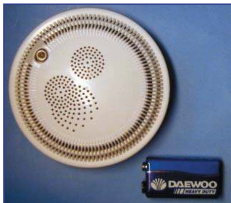
Автономный дымовой извещатель

В настоящий момент доступны два вида извещателей: двухпроводный дымовой оптический ИП 212-18СИ и автономный дымовой оптический ИП 212-07СИ. Также как и извещатели других производителей, представленные модели устанавливаются в базовые основания, закрепляемые на строительной конструкции. Оба извещателя поставляются в комплекте с базовыми основаниями.