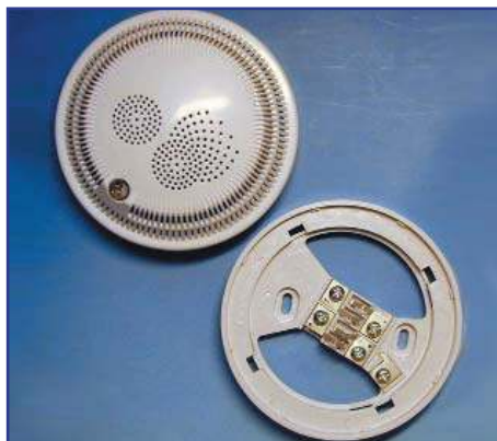
Дымовой оптический извещатель