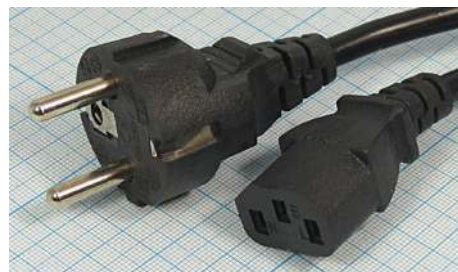
Артикул Q-3066 (прямой)