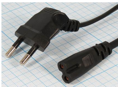
Артикул Q-3069У (угловой)