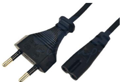
Артикул Q-3069 (прямой)