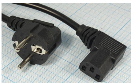
Артикул Q-3066У (угловой)