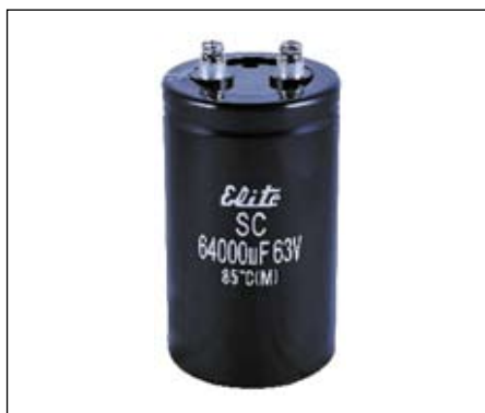
Рис. 2. Внешний вид конденсаторов с терминалами под резьбу

Внешний вид конденсаторов Elite с терминалами под резьбу приведен на рис. 2.