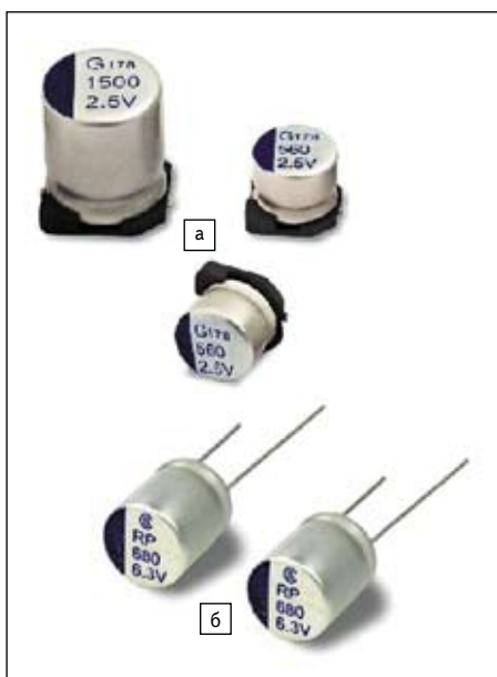
Рис. 5. Внешний вид полимерных конденсаторов: а) для монтажа на поверхность; б) с проволочными выводами

Внешний вид полимерных конденсаторов Elite в корпусах для монтажа на поверхность показан на рис. 5а, а в корпусах с проволочными выводами — на рис. 5б.