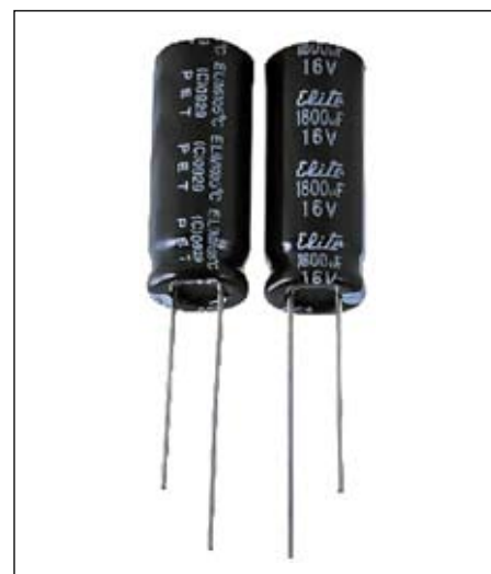
Рис. 3. Внешний вид конденсаторов с проволочными выводами

Внешний вид конденсаторов Elite с проволочными выводами показан на рис. 3.