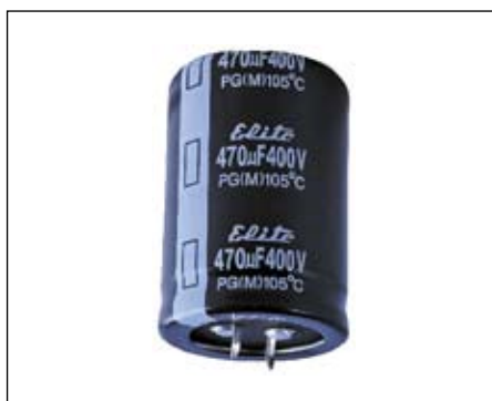
Рис. 1. Внешний вид конденсаторов типа Snap-In