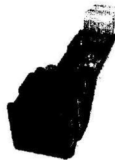
Рис.1 Общий вид устройства

По устойчивости к воздействию внешних климатических факторов компьютер соответствует категории 2 и климатическому исполнению ГОСТ 15150-69.